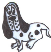
Athos 6, Page 16

Frais de gestion (recherche propriétaire...) : 16€