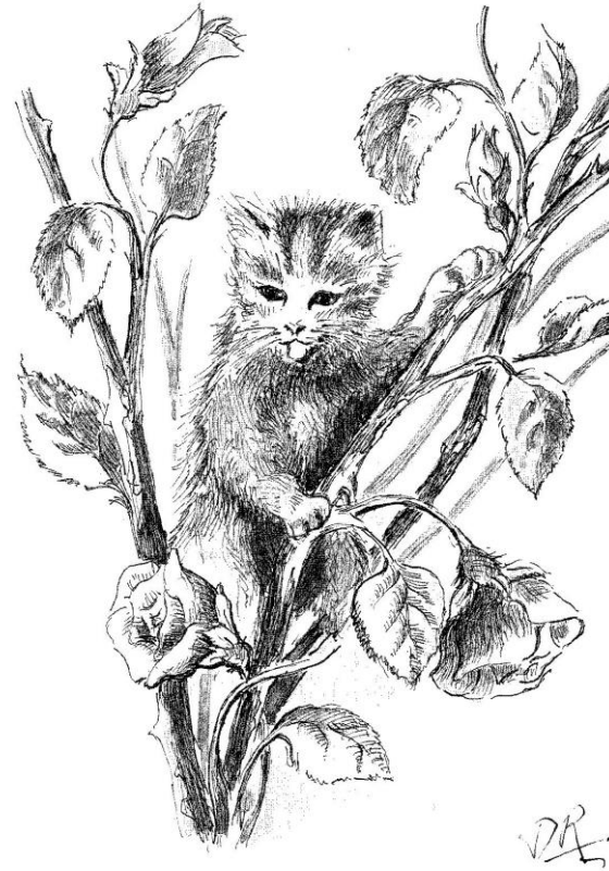
Illustration extraite d'un livre pour enfants, écrit par Mme Annick ...sous le nom d'auteur Soizic Monher et sous le titre « Mistigri Poulgwenn...un éternel amour »

Le quotidien du refuge nous montre suffisamment de comportements humains égoïstes et irresponsables pour qu'on ne résiste pas au plaisir de pointer, pour une fois, une attitude digne de notre respect.