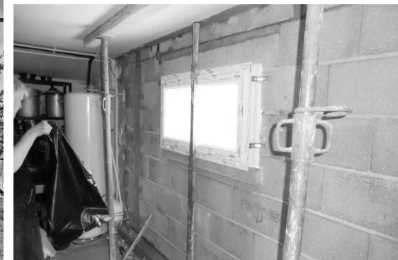
Pose de la fenêtre

Les fissures ont disparu, le mur tout neuf est prêt à affronter les quarante prochaines années !